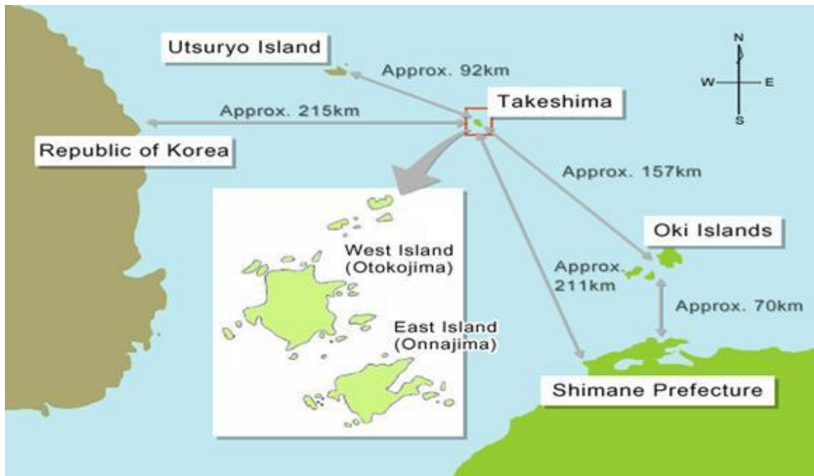
Fig.3 – Takeshima/Dokdo