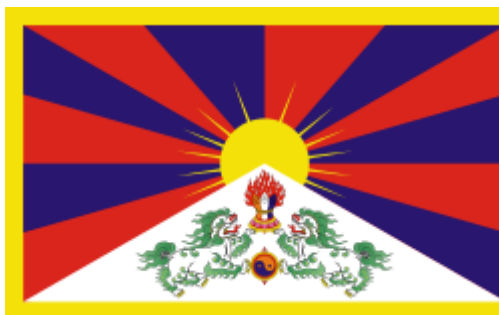
La bandiera tibetana 3

sono ancora vigenti e si ritiene che la repressione sia persino incrementata durante il governo di Xi Jinping. Sia la bandiera sia l'inno nazionale tibetani sono proibiti in Cina; l'esposizione o possesso della bandiera e il canto o il possesso di registrazioni dell'inno hanno portato a vari arresti. Nel Tibet ai professori universitari viene vietato di discutere su certi argomenti ed il governo controlla il curriculum ed i libri di testo delle scuole. E' proibita inoltre la pubblicazione di libri il cui contenuto sia giudicato politicamente delicato. L'intensa censura del Tibet ha come scopo quello di fermare la circolazione di versioni della storia tibetana che siano in contraddizione con quella approvata ufficialmente dalla RPC. Dal 2008 oltre 60 intellettuali, scrittori, artisti e musicisti, le cui opere celebrano l'identità tibetana, sono stati arrestati, accusati di ispirare sentimenti antigovernativi e di incitare al separatismo, e puniti con lunghe pene che arrivano fino ai 9 anni.