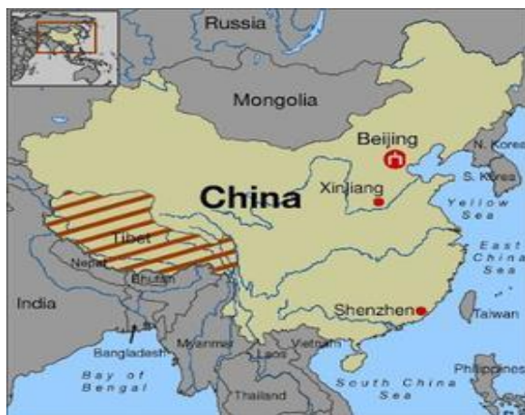
La Cina e la Regione Tibetana Autonoma 1

Tra i vari movimenti indipendentisti affrontati dalla Cina, stato multietnico, quello del Tibet è probabilmente il più noto. La Cina ha controllato il Tibet, anche se in forme diverse e con varie interruzioni, dal XIII secolo, quando il Tibet venne conquistato dalla dinastia Yuan, di origine mongola. Per prevenire un'invasione militare, Sakyapa Pandita, il più eminente lama (monaco buddista tibetano) dell'epoca, si sottomise ai Yuan in nome del Tibet, ricevendo in cambio la loro protezione per la sua setta, i Sakyapa, i quali divennero i rappresentanti dei Yuan nel Tibet. Ebbero così inizio due peculiarità che caratterizzano la storia tibetana: il governo monastico e la dipendenza di questo dalla protezione da parte di potenze straniere.