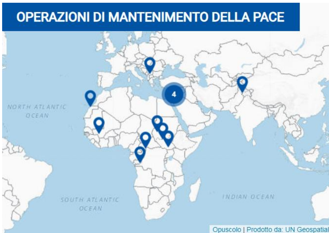
Figura 1: Le operazioni di peacekeeping dell'ONU nel 2020.

Infine, nel 2018 si è registrato il minor numero di decessi di unità impiegate in operazioni di pace dal 2012. I 27 decessi si sono verificati tutti nel continente africano, ma in diverse operazioni di pace; di queste 27 vittime, 20 provenivano da paesi africani e sette da paesi dell'Asia meridionale.