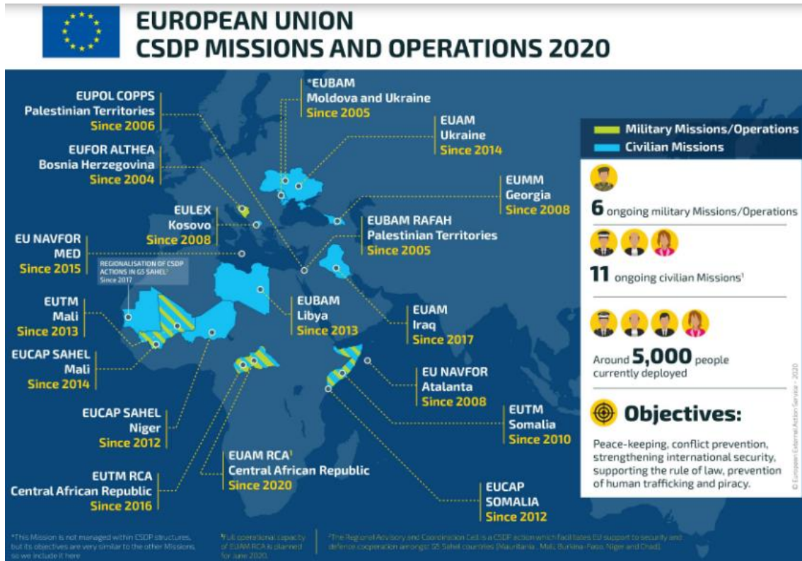
Figura 2: Le operazioni di peacekeeping dell'UE nel 2020.